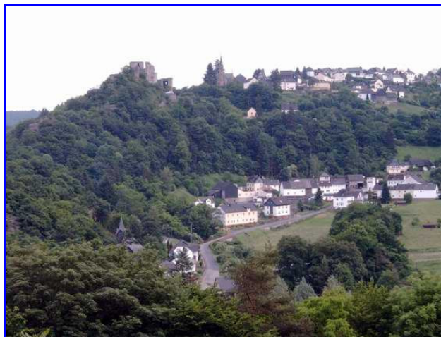
Blick vom Platz auf Burg Hohenstein

Bis Wiesbaden oder Limburg/Lahn. Von dort aus gibt es Busverbindungen ( www.ORN.de ).