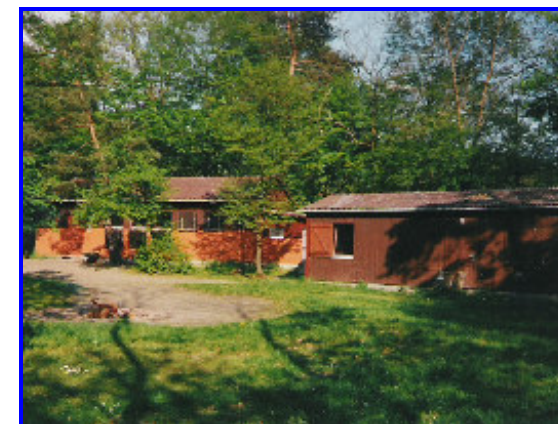
Hauptgebäude und Schlafhaus